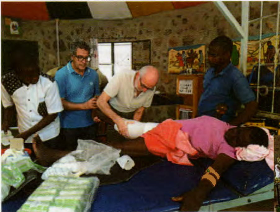
lavorativo, sociale, relazionale ecc...]